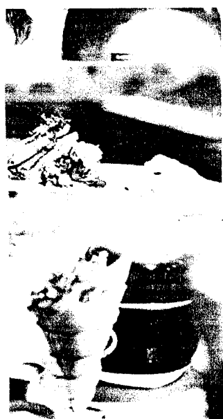
he gerechten, zoals mosselen en frieten (kl.).

Je bent toch nog een beetje land? «Het zal wel zijn! Ik ben fier om zijn, maar hier ben ik Belg. Vlaan niemand. Het probleem met d net dat ze niet fier genoeg zijn braaf, te bescheiden, te verlegier staan en te zeggen: 'Ik ben di moet natuurlijk okeecht wel dr hé. Maar neem van mij aan dikwijls top. We durven het ge zeggen. Welnu, daar doe ik nie mee.»