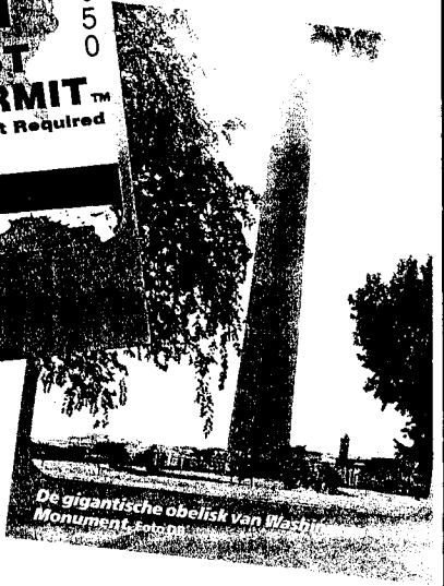
De gigantische obelisk van Washington Monument.