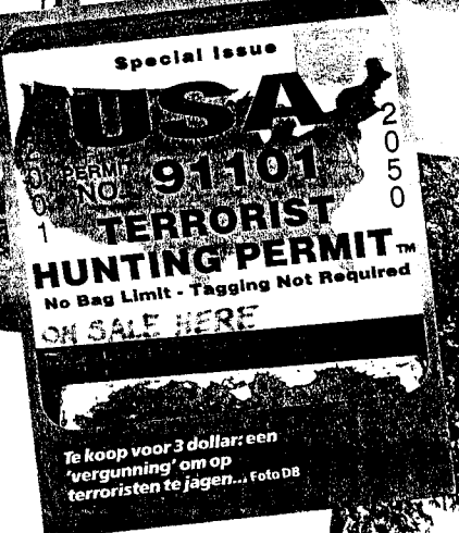
Te koop voor 3 dollar: een 'vergunning' om op terroristen te jagen...