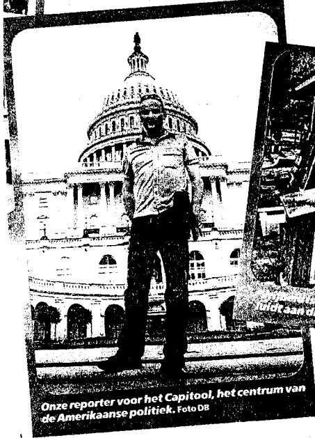
Onze reporter voor het Capitool, het centrum van de Amerikaanse politiek.